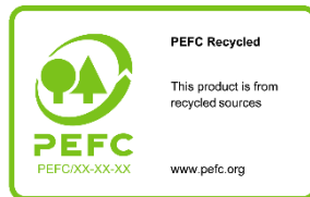
Tableau 2 : Aperçu des options d'utilisation de PEFC sur les labels de produits

7.1.2.2.1 Le label PEFC recyclé devra être utilisé lorsque le produit inclut uniquement de la matière recyclée (voir 3.15, définition de la matière recyclée ). Le nom du label est « PEFC recyclé » et le message du label : « [Ce produit] est issu de sources recyclées ». La mention [ce produit] peut être remplacée par le nom du produit certifié ou de la matière certifiée incluse dans le produit auquel le label fait référence, en utilisant le générateur de labels.